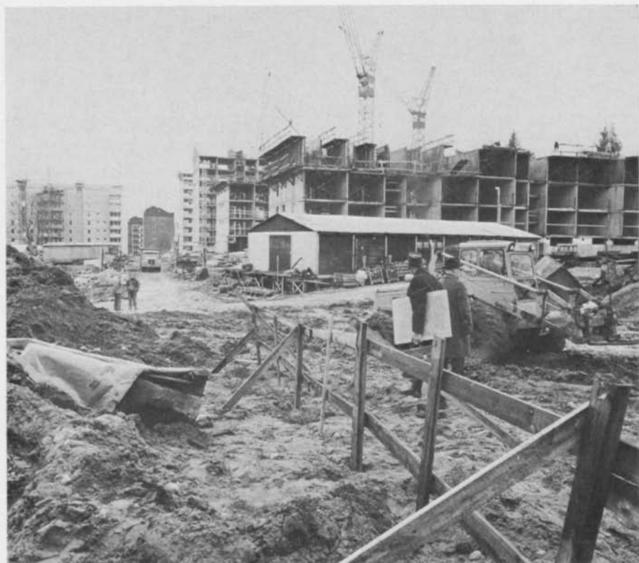
Fig. 1. Den nyfunna Vilunda-stenen på arbetsplatsen. Runstenen ligger till vänster omedelbart innanför staketet. Foto Runverket, Sören Hallgren 1971. — The newly found Vilunda runestone on the work site. The runestone lies to the left, immediately inside the fence.

den nyfunna stenen åter har rests på sin gamla plats, kunnat använda samma skolstenar som då runstenen ursprungligen restes.