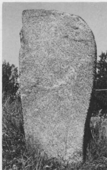
Fig. 5. Bautastenen i gravfältet vid Lilla Vilunda. Foto Runverket, Gabriel Hildebrand 1972. — The monumental stone in the gravefield at Lilla Vilunda.

reslig bautasten, avsevärt högre än runstenen, i ett uppländskt gravfält från vikingatiden. (Bautastenen är resligare än vad som uppges i ämbetets fornminnesinventering; den mäter 177 cm, runstenen 156 cm.) Stenen står rest endast 45 m N om U 293.