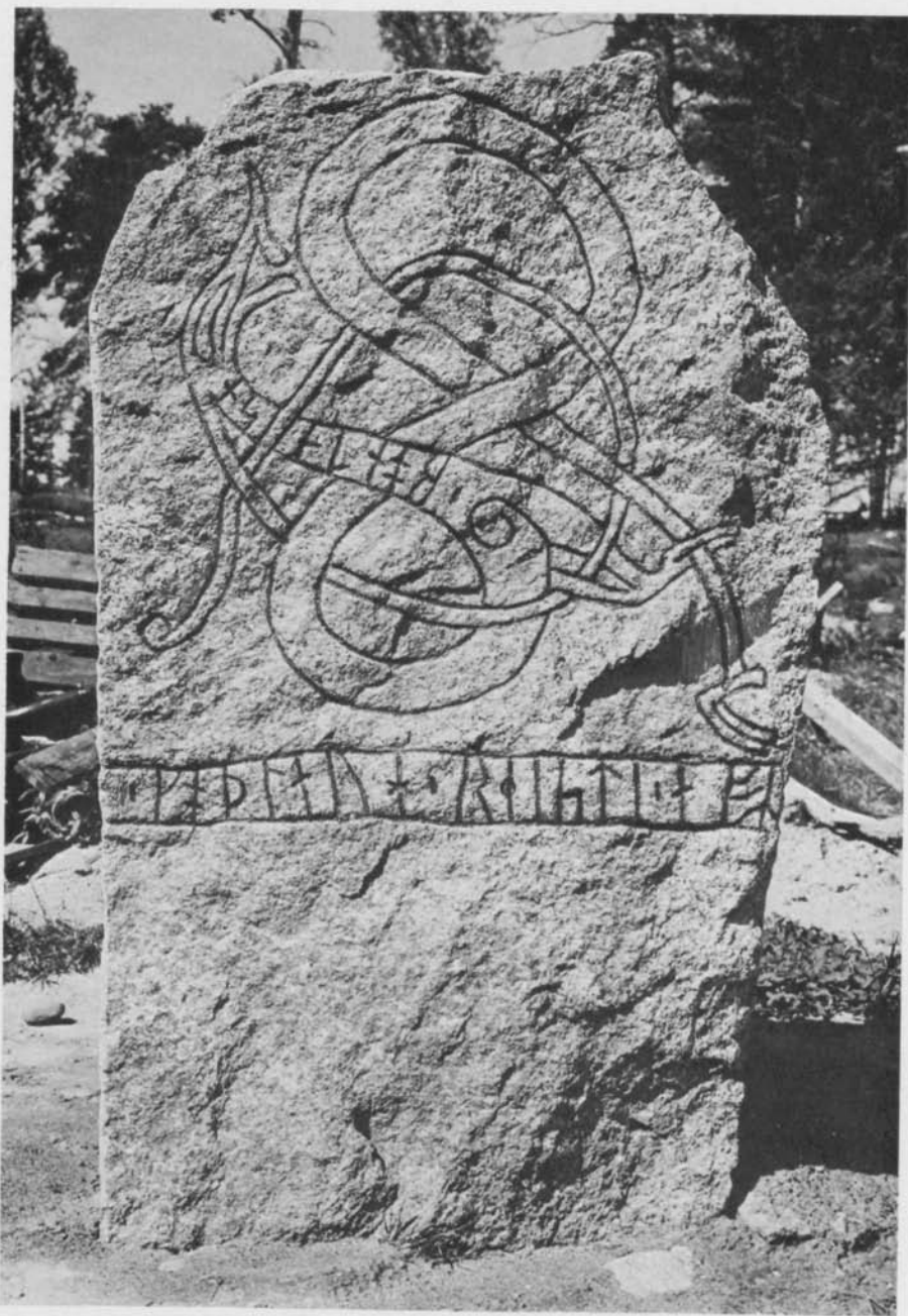
Fig. 2. Den nyfunna runstenen. Foto Runverket, Gabriel Hildebrand 1972. — The newly found runestone.